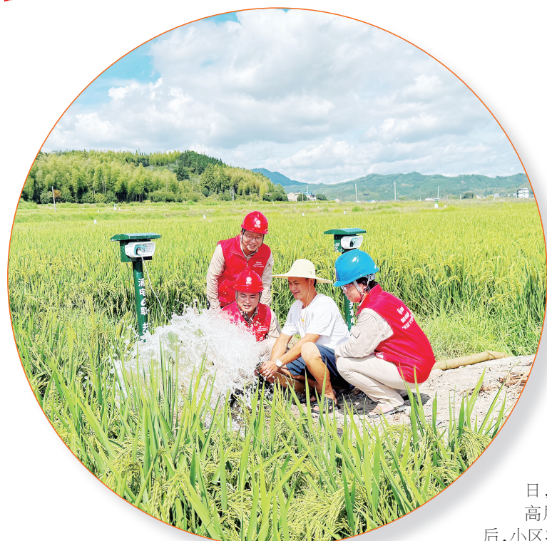
国网福建电力推广“扫码即用、用完即走”的共享用电新模式。