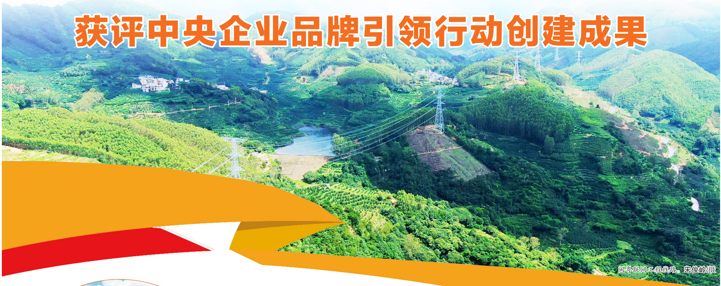
闽粤联网工程线路。