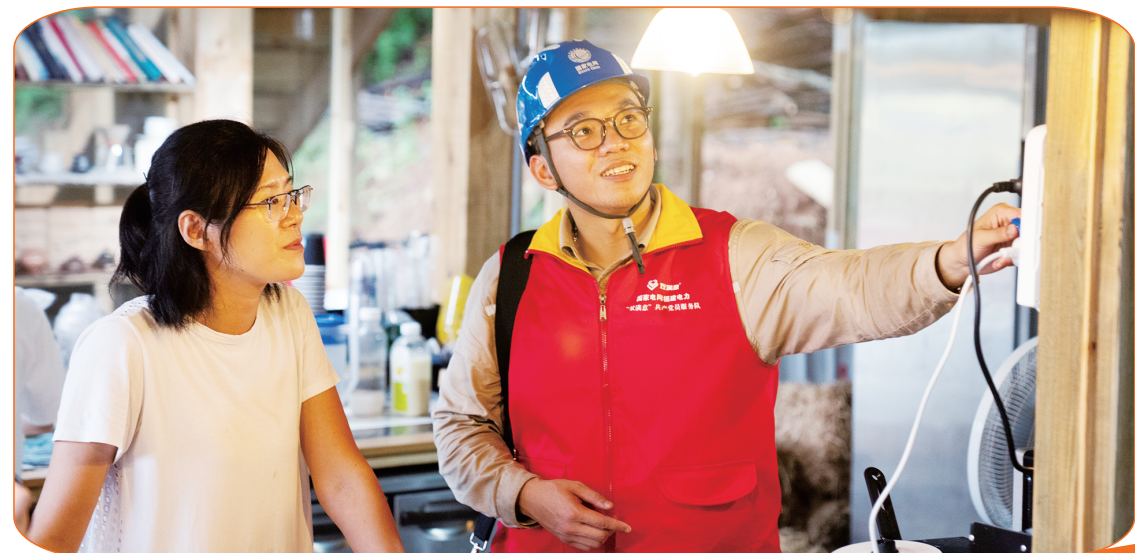
国网福建电力员工为商户检查用电设备。

国网福建电力将“架起党联系服务群众连心桥”作为电力“双满意”的品牌定位,嵌入政府公共服务,以二十多年如一日的责任担当为社会提供优质用能体验,更好聚民心、暖人心,实现让党和政府满意的目标;为人民群众提供优质用电服务,解决好老百姓生活中各项用电问题,让电力事业发展成果惠及全民,实现让人民群众满意的目标。