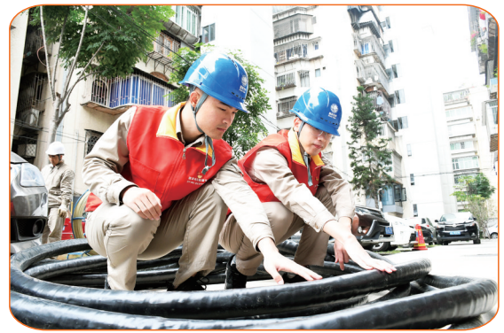
国网福建福州供电公司开展老旧小区供配电设施升级改造。

立足新起点,国网福建电力将持续深入实施新时代电力“双满意”工程,全力打造“为民办实事标杆、央企责任担当典范”,以更优质的供电服务保障,满足人民美好生活用电需求。