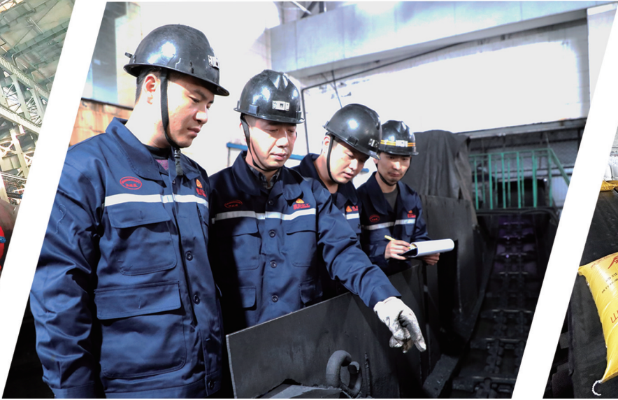
图为王庄煤矿选煤厂员工对皮带运输煤量进行现场测算和取样