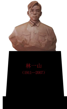
《林一山雕像》赵学强创作