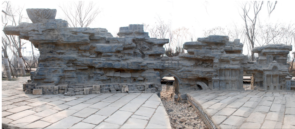
济南腊山河公园内雕塑作品《老济南》赵学强创作

赵学强,山东建筑大学艺术学院景观艺术设计系主任、党支部书记、副教授,硕士研究生导师;教育部学位与研究生教育发展中心专业学位评估专家、全国乡村建设高校联盟乡村艺术建设专项委员会常务委员、中国风景园林学会文化景观专业委员会委员;教学成果获得山东省教学成果奖一等奖,设计作品《九雅—东峪艺术古村环境项目设计》入选第十四届全国美术作品展览。