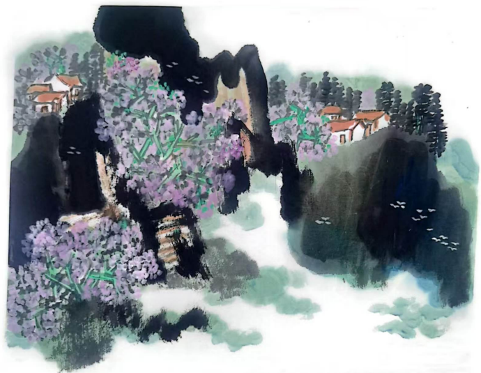
《家在云山中》王建树作