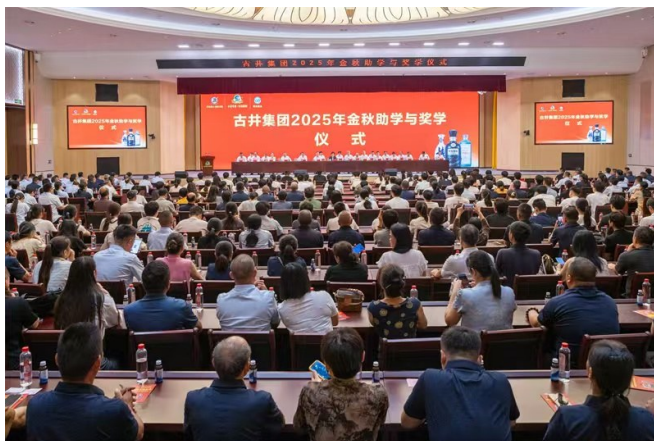
古井集团举办2025年金秋助学与颁奖仪式。

民主管理是古井集团凝聚人心、汇聚智慧的“金钥匙”。集团持续深化厂务公开，让集体协商成为职工共享发展成果的坚实保障。特别是通过建立“时时对话 处处沟通”的数字化意见反馈平台，实现了职工诉求的即时转办与100%答复。在职工现场提问、公司领导现场解答的环节，更是将民主协商落到实处。这些卓有成效的实践，凝结成了“四度四有”“一平台四热线”等荣获全国及省级荣誉的创新案例，成功通过全国企业民主管理工作的严格检阅，搭建起一条高效、透明的“民意高速路”，让