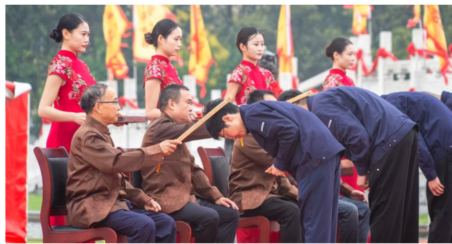
古井贡酒《九酝酒法》非遗酿造工艺传承人拜师仪式。

色。从关注职工身心健康的“心灵驿站”“女工家园”，到扎实做好“四季送”“五上门”等品牌服务；从提供免费工作餐、健康体检等全方位福利，到打造花园式工厂、营造“书香企业”氛围……集团通过做好一件件具体而微小的工作，不断提升着产业工人的幸福感、归属感和安全感，真正为职工解除了“后顾之忧”，让他们能够全身心投入公司的建设与发展，形成了企业与职工命运与共、和谐共赢的生动局面。