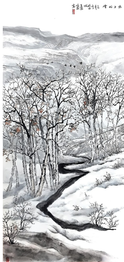
《塬上的雪》吕峻涛作