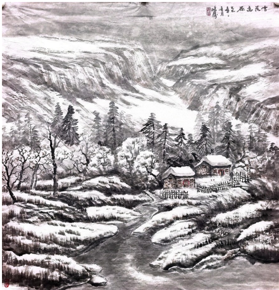
《雪落高原》吕峻涛作