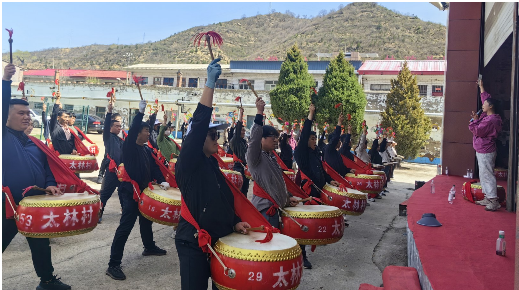
山西省临汾市蒲县太林乡党委运用“道德银行”激励机制,组织群众筹备“东醮朝山”非遗展演。