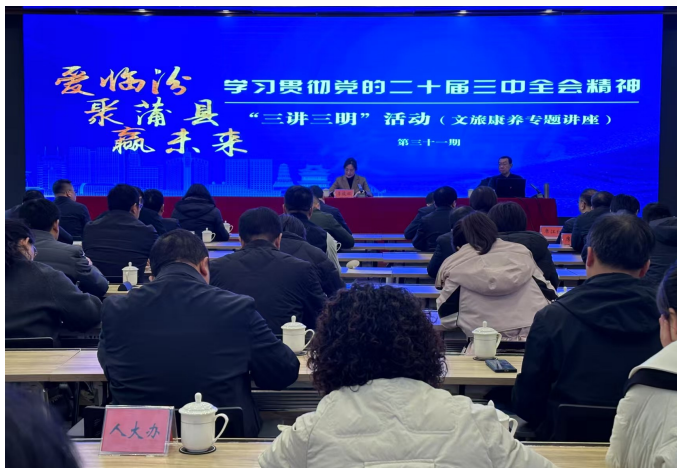
山西省临汾市蒲县举行领导干部上讲台“三讲三明”活动第31期——学习贯彻党的二十大精神文旅康养专题讲座。

全国组织部长会议强调,“把坚持用改革精神和严的标准管党治党落实到组织工作全过程各方面”。组织部门作为管党治党的重要政治机关,要站在组织路线服务政治路线的高度,在铸魂赋能、选贤任能、固本强能、人才聚能等方面持续用力,以实干实效奋力推动组织工作全面提质提速,为蒲县加快建设沿黄板块区域中心和打造经济增长极提供坚强组织保障。