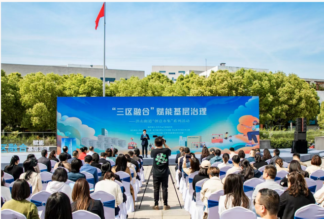
湖北省武汉市洪山区举办“三区融合”赋能基层治理启动仪式。

办好民生实事。针对居民群众反映强烈的老年人上下楼难及停车难、充电难等急难愁盼问题，推动社区、高校、企业问题共答、难题共解。去年以来完成老旧小区加装电梯90部、增设停车位1651个、新建电动车棚368个，办成一批群众关注的好事实事。组织开展“高频问题·你我共解”，梳理16类民生共性问题的化解举措，按照可复制、可推广标准，汇编《基层治理“高频问题·社区答案”案例选编》两册，开设“社区答案·你我共学”专栏，展示为民办实事做法28期，引导街道社区互学互鉴，推动从解决一个问题向解决一类问题转变，提升为民服务质效。