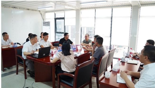
广东省东莞市洪梅镇召开城中村改造调度会。

为才有位”“有位更有为”导向，把一线考察的工作结果运用到选拔机制中，做到赏罚分明、激励有效。建立“三优先”激励机制，对城中村改造工作中表现优秀的干部在评选先进、职级晋升、选拔任用等方面优先考虑，不占用单位优秀名额，共有26名表现突出的优秀党员干部获得提拔重用，24名年轻干部纳入后备人才库重点培育，以实绩导向激发党员干部服务城中村改造项目的澎湃动力。