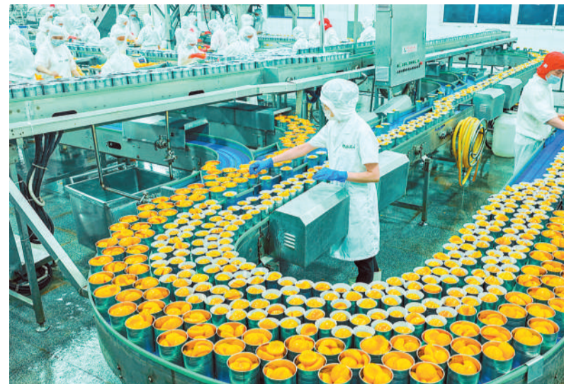
时下,湖北省宜昌市秭归县高山地区的黄桃、杨梅、脆李等特色水果进入丰收季,当地食品加工企业将鲜果加工成罐头、果干、果酱等产品,持续拓宽销售渠道。图为工人在秭归县一家食品加工企业车间内生产黄桃罐头。

基础设施、城市地下管网、重大水利工程、西部陆海新通道、高等教育提质升级、“三北”工程等重点领域。加快推进规划编制、政策制定、体制机制创新等措施,包括完善铁路投融资和价费机制,支持长江沿线城市开展污水处理收费模式改革,研究制定各类防洪工程设施稳定运用年限标准,深化农业水价综合改革等,高质量推进“两重”建设各项任务。