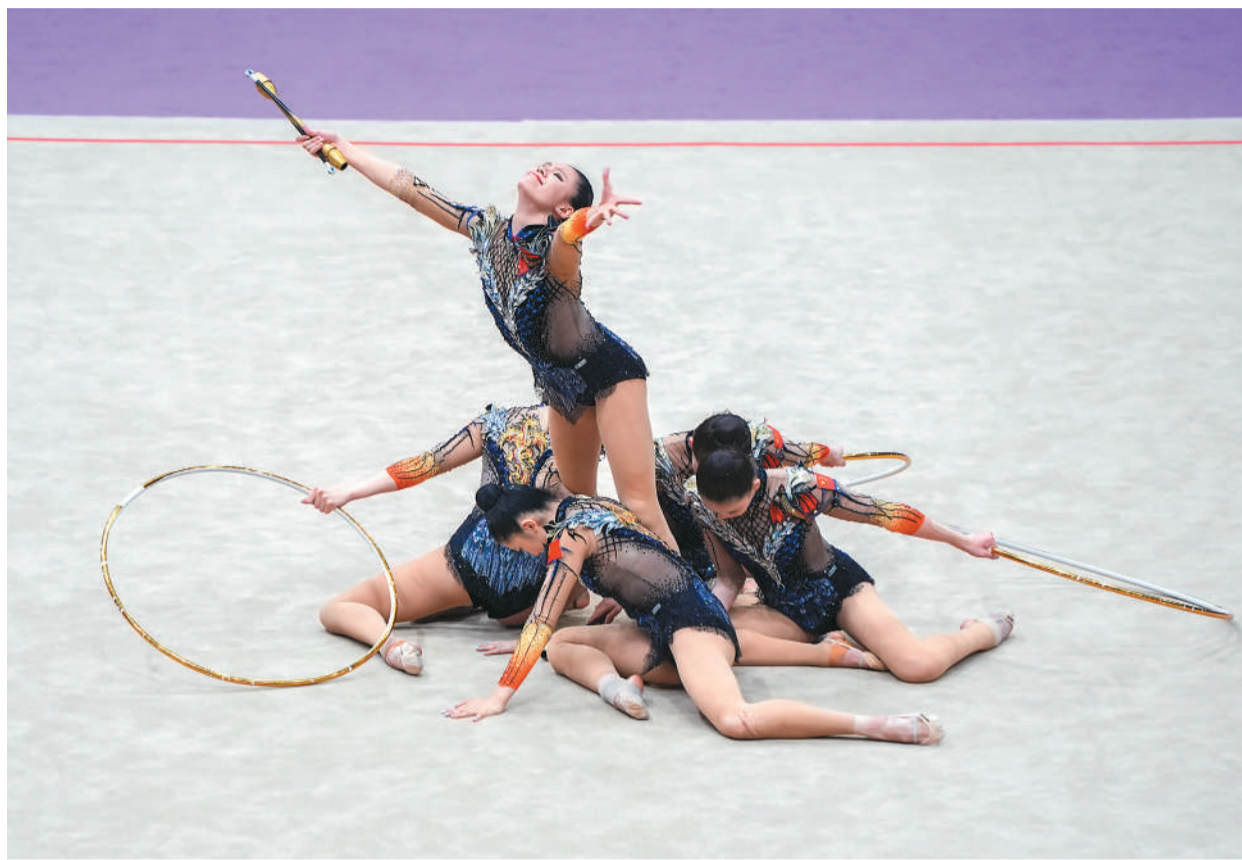
中国队在集体项目3圈2棒决赛中。

巴黎奥运会上，中国艺术体操队在集体项目中实现历史性突破，首夺奥运会金牌。进入洛杉矶奥运周期后，队伍面临阵容调整和规则变化，更多年轻队员走到台前。检验成套、磨合阵容、查找问题、展示风采……通过本次比赛，中国艺术体操队完成了一次重要的阶段性检验。