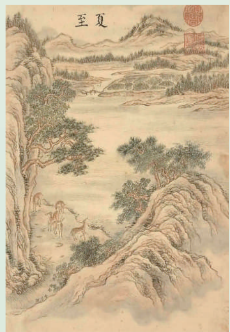
清·张若霭《墨妙珠林》(卯)册中的夏至 台北故宫博物院藏