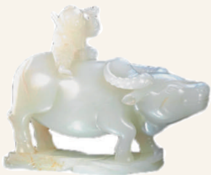
清·玉牛童 天津博物馆藏

分、夏至、秋分、冬至。 “秦汉时期是二十四节气定型的重要阶段。”二十四节气保护传承联盟秘书长唐志强介绍，“西汉初年的《淮南子》首次记录了二十四节气的完整名称与顺序。公元前104年，汉武帝颁布《太初历》，正式将二十四节气纳入历法，指导全国的生产生活实践。”