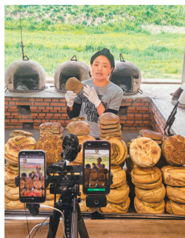
通过直播平台推介焜锅馍产业基地，主播正在直播。

“我们这款馍馍有香豆、胡麻儿几种口味，用的是高原青稞面粉，欢迎大家尝尝地道老味儿……”青海省西宁市湟中区海亚焜锅馍产业基地，主播正在直播平台推介当地特色焜锅馍。