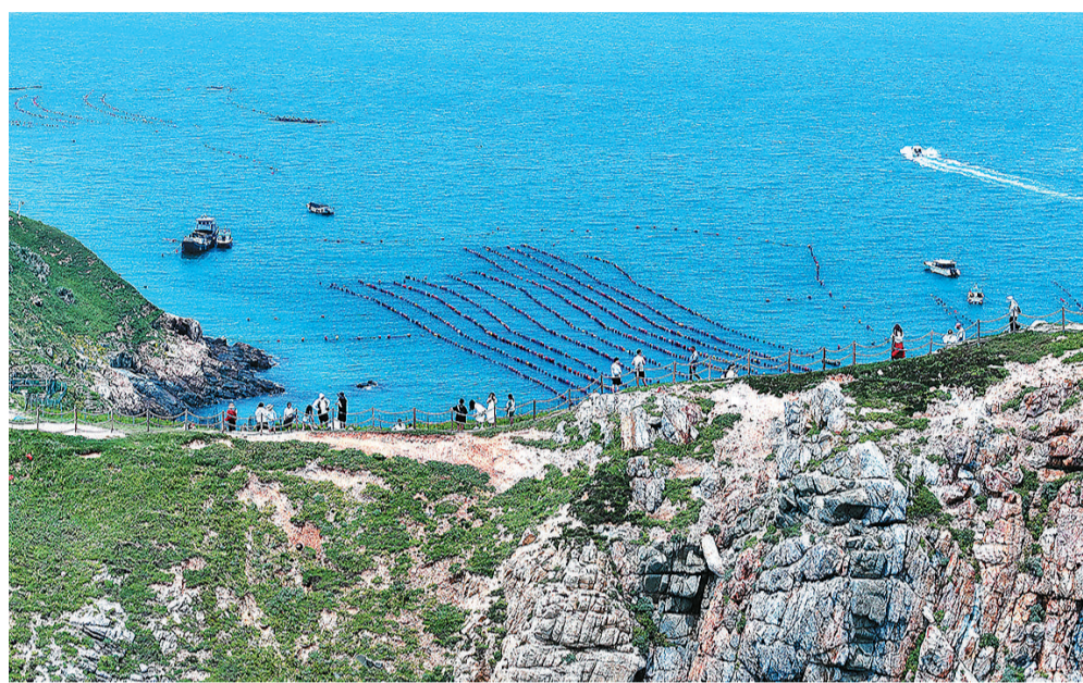
游客在霞浦县东礞岛游玩。