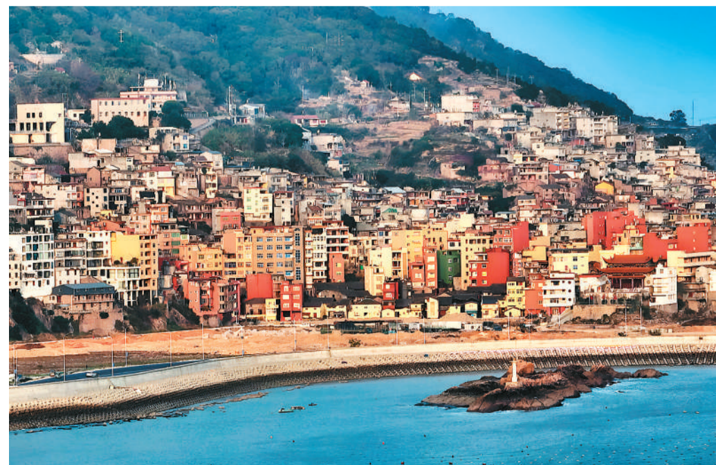
霞浦县三沙镇滨海观光道和沿岸的民宿群。