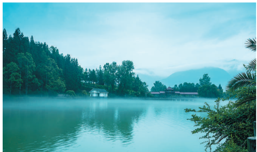
四川省越西县水观音潭。