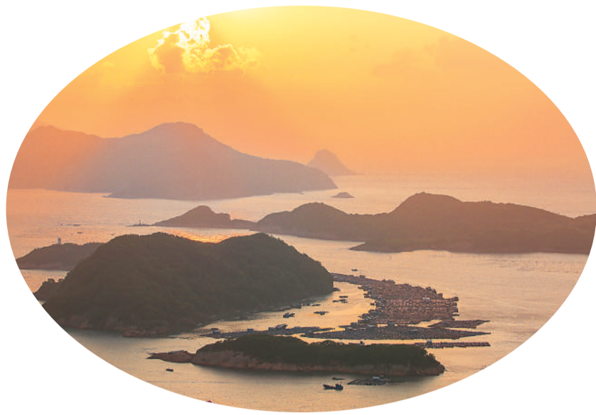
福建省霞浦县三沙镇花竹村海上养殖场，在朝霞映衬下格外美丽。