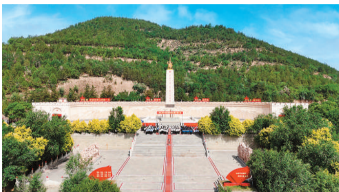
外景。中央红军长征胜利纪念馆。

陕北黄土高原，阳光洒在中央红军长征胜利纪念馆的墙面上。纪念馆展厅里，人潮涌动。展柜中，磨穿的草鞋、锈迹斑斑的马灯、泛黄的行军文件等，静静地诉说着历史。