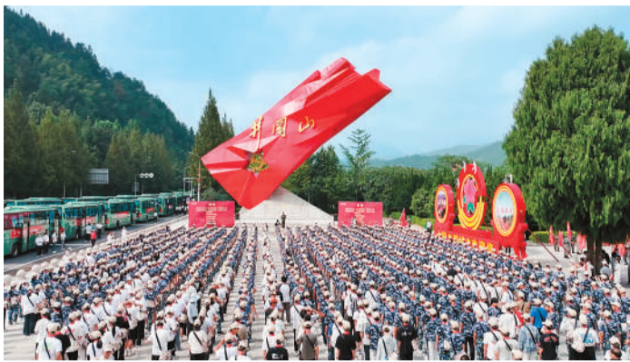
井冈山红旗广场上举行思政实践活动。

井冈山革命博物馆第三展厅的一处展柜中，柔和的灯光落在《中国的红色政权为什么能够存在？》《井冈山的斗争》两本小册子上，吸引观众俯身细看。