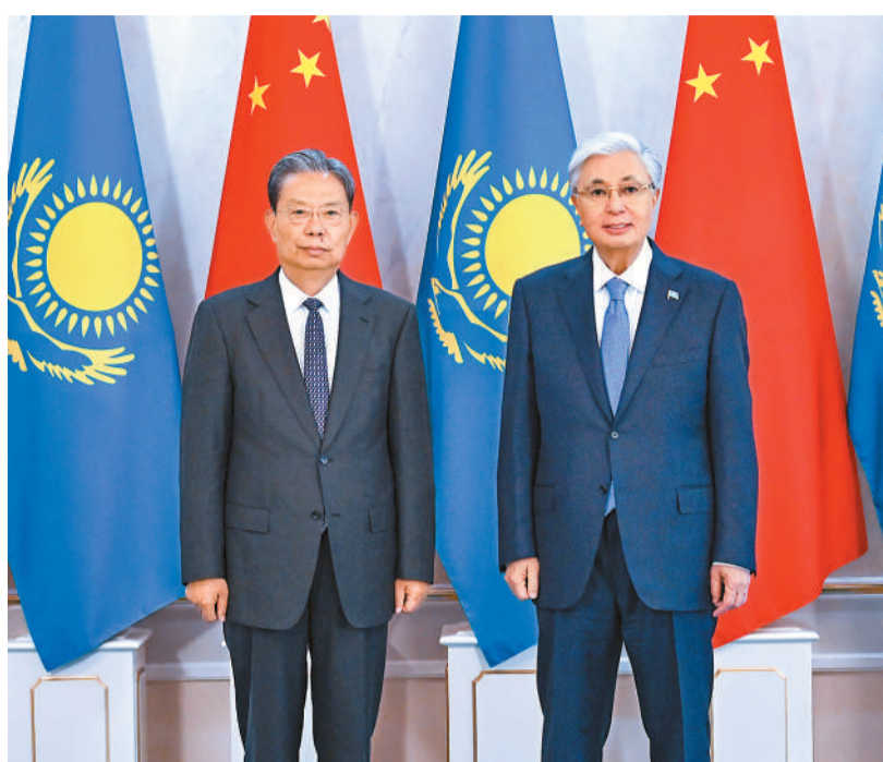
应哈萨克斯坦议会下院议长科沙诺夫邀请，全国人大常委会委员长赵乐际5月25日至27日对哈萨克斯坦进行正式友好访问。这是5月26日赵乐际在阿斯塔纳会见哈萨克斯坦总统托卡耶夫。