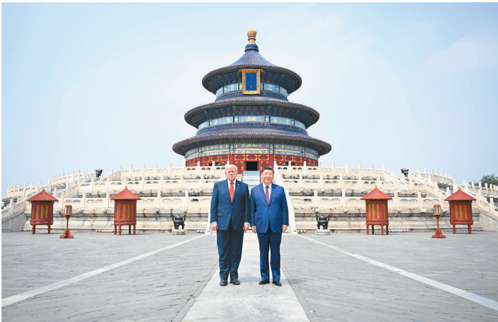
五月十四日, 国家主席习近平同来华进行国事访问的美国总统特朗普参观天坛。两国元首在祈年殿广场合影。