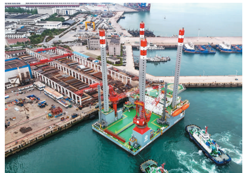
5月14日，我国首座海上移动式多功能措施平台“海洋石油283”从山东省青岛市西海岸新区启运，发往渤海油田。该平台采用“移动式+模块化”设计，总重7300余吨，最大作业水深40米，集酸化、压裂、调驱、调剖、稠油热采等功能于一体，并引入AI智能监测，投用后将有效支撑渤海油田增储上产。

据了解，税务部门会同医保等部门，持续优化基本医疗保险参保缴费服务举措，不断提升便民缴费服务质效。目前已在全国范围内全面实现基本医疗保险缴费“网上办”“掌上办”，线上业务办理占比稳定保持在95%以上，并设置5000多个便民绿色通道，专门服务老年人等特殊缴费群体，大幅提升群众医保缴费便利度。国家税务总局社会保险费司有关负责人表示，税务部门将持续升级社保缴费服务，推出线上社保费智能申报提醒功能、推进灵活就业人员参保缴费“一件事”、开通个人社保缴费记录线上查询等多项便民举措。