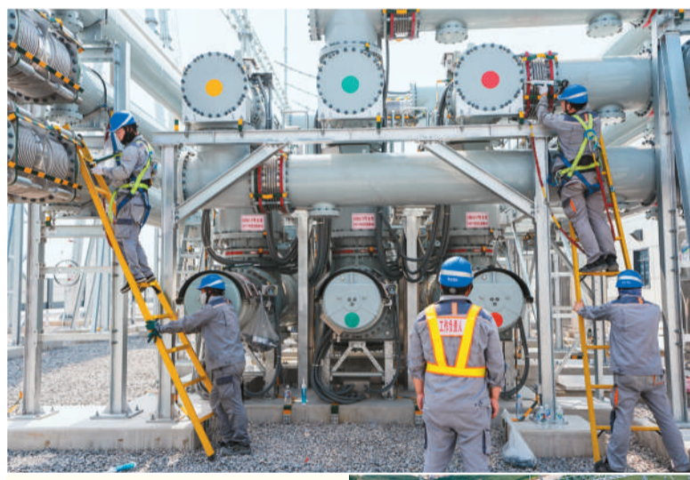
上图：施工人员对该输电变电工程开展验收作业。