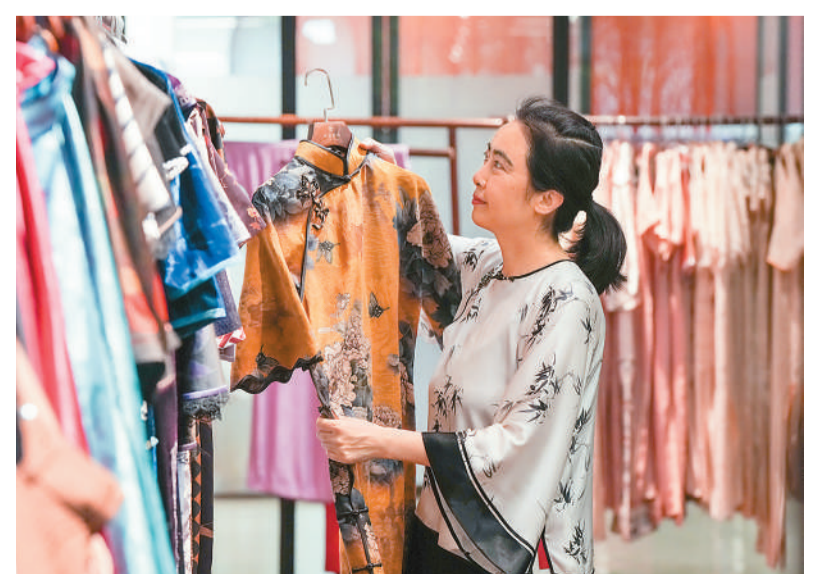
近年来，江苏省昆山市花桥经济开发区依托区位优势，大力发展时尚创意产业，逐步形成“创意设计+人才集聚+全产业链”的特色发展模式。目前，当地已建成的时尚创意产业园集聚近150家时尚企业、近300名设计人才，孵化超30个新锐品牌。图为在昆山市花桥晨风产业园，某旗袍品牌工作人员在工作室内整理旗袍。

下一步，农业农村部将密切跟踪《方案》落实情况，加强监测预警，压实地方属地责任，强化政策协同，健全上下联动、响应及时的生猪产能综合调控机制，推动生猪价格保持在合理水平，更好稳定产业发展。