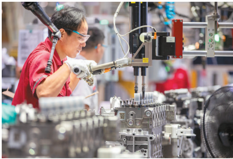
湖北省襄阳市大力推动产业数字化转型，促进区域经济高质量发展。图为5月14日，在襄阳市一家发动机生产企业车间内，工人赶制订单产品。

北京市统计局副局长朱燕南说，今年一季度，北京服务业实现增加值1.1万亿元，同比增长6.4%，比全市GDP增速高0.5个百分点，占全市GDP的比重达到88%，信息服务业、