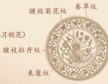
缠枝牡丹纹 束莲纹