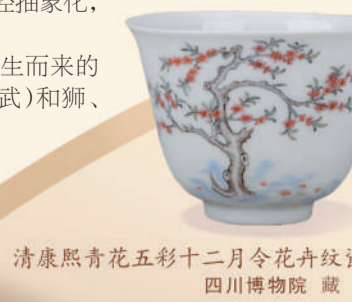
清康熙青花五彩十二月令花卉纹瓷杯（三月桃花） 四川博物院 藏