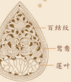
百结纹 鸳鸯纹 莲叶纹