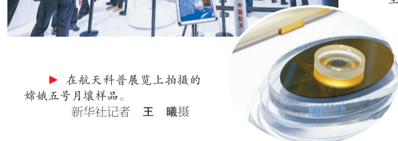
在第十一个“中国航天日”主场活动上,观众参观航天科普展览。