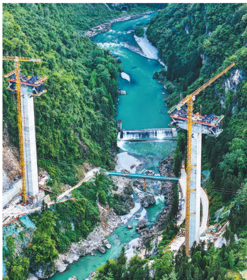
位于湖北省恩施土家族苗族自治州恩施市屯堡乡马者村的姚家平水利枢纽工程,是清江流域上的控制性工程,最大坝高175米,设计为碾压混凝土双曲拱坝。工程建成后,可有效控制洪水、削减洪峰,提升当地防洪能力。