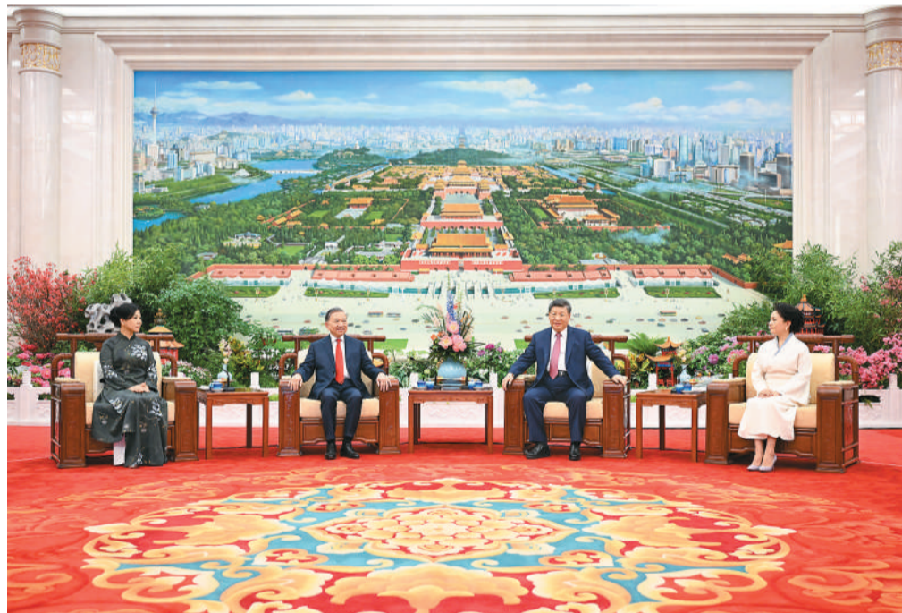
新华社北京4月15日电 4月15日下午,中共中央总书记、国家主席习近平和夫人彭丽媛同来华进行国事访问的越共中央总书记、国家主席苏林和夫人吴芳瑞亲切话别。 习近平说,今天我同苏林总书记、国家主席就共同关心的全局性、

战略性问题进行了长时间深入交流,达成许多新的重要共识。我突出感受到,中越都是社会主义国家,我们要继续沿着这条道路确定的方向坚定前行,做社会主义事业的命运共同体;我们是休戚与共的好邻居,正在共同奔向现代化,要做实现现代化的