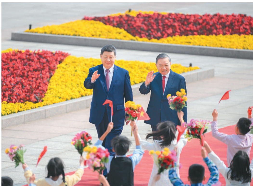
四月十五日上午,中共中央总书记、国家主席习近平在北京人民大会堂同来华进行国事访问的越共中央总书记、国家主席苏林举行会谈。这是会谈前,习近平在人民大会堂东门外广场为苏林举行欢迎仪式。