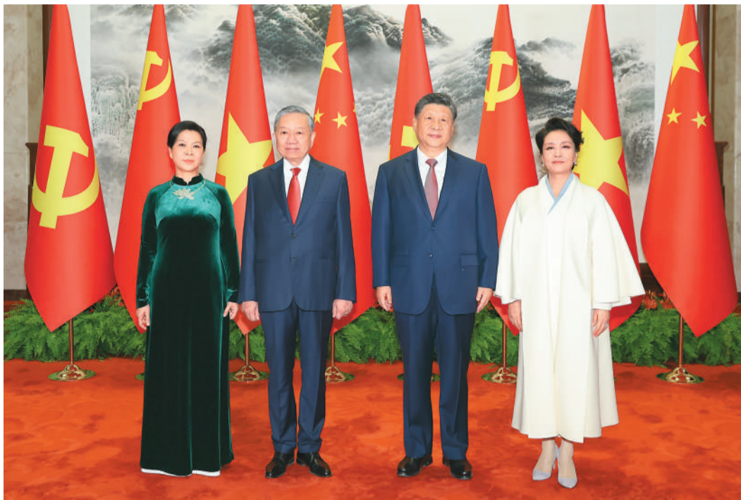
四月十五日上午,中共中央总书记、国家主席习近平在北京人民大会堂同来华进行国事访问的越共中央总书记、国家主席苏林举行会谈。这是会谈前,习近平和夫人彭丽媛同苏林和夫人吴芳瑞合影。