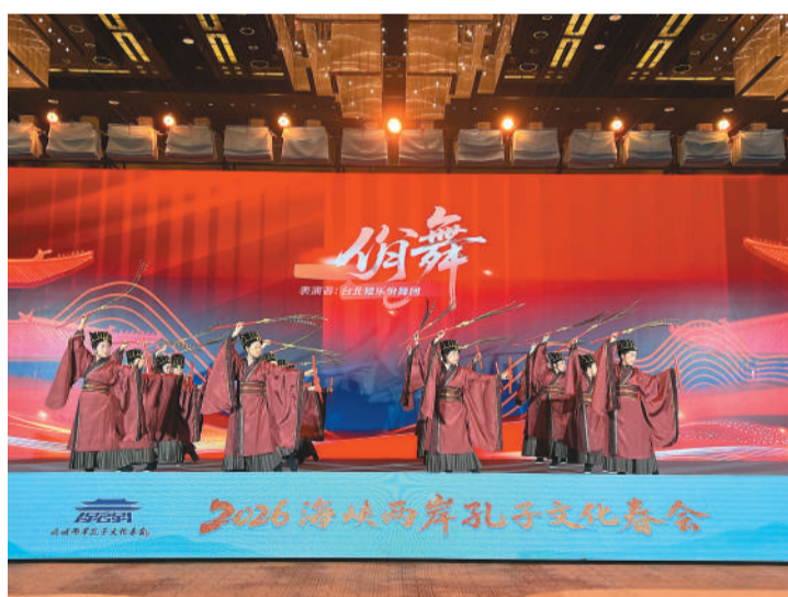
表演。海峡两岸孔子文化春会启动仪式现场的敬师礼。

本届春会以“共沐儒风 同迎春韶”为主题，将持续至4月5日，涵盖启动仪式、海峡两岸青年同祭孔、礼乐嘉年华、敬师礼、孔门四科与现代教育会讲等十多项活动，预计将有3000余名两岸同胞参与。