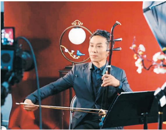
▲中央民族乐团二胡首席金玥正在直播。