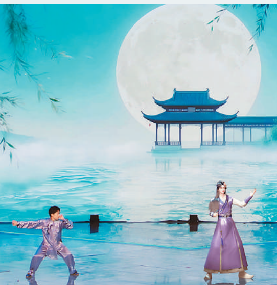
虚拟主播(右)与八极拳传承人(左)联动演绎节目。

来自不同领域的“国潮推荐官”为舞台注入专业力量。女高音歌唱家么红在《珠玉》合作舞台融入美声花腔，展现中外声乐艺术的碰撞；打击乐演奏家王佳男以节奏为桥，用中国大鼓模拟黄河奔涌，与呼麦、中提琴打造《将进酒》“三重交响”；京剧表演艺术家胡文阁将《霸王别姬》《杨门女将》等经典唱段与流行元素大胆融合，以跨越时空的演绎重塑戏曲魅力。