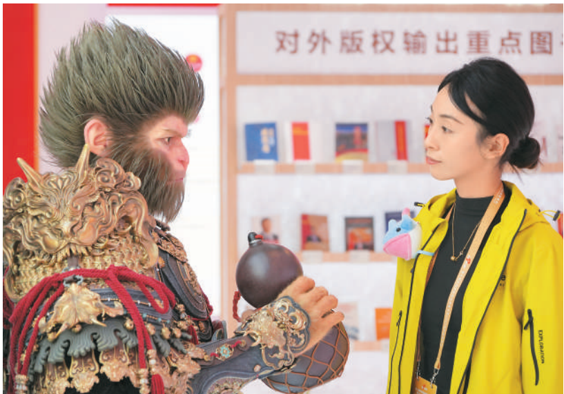
2025年10月17日，观众在第十届中国国际版权博览会上观看游戏《黑神话：悟空》中角色模型。

这类“崩坏”作品的评论区里，有网友说：“头一次看挺新奇，看多了发现内容空洞无物，没意思，甚至让人生理不适。”