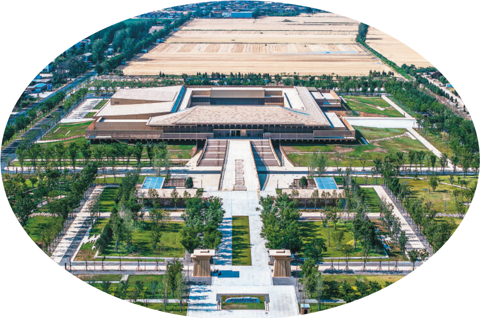
▲汉魏洛阳故城遗址博物馆外景。