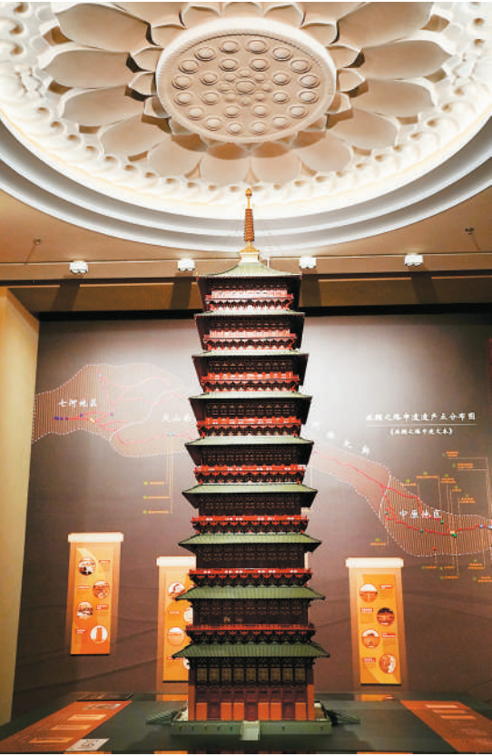
▲永宁寺塔模型。

“开馆不足半年，博物馆成为参观、研学热门打卡地。东汉鎏金铜牛和西晋金马、西晋陶鬲头等文物，因其形态可