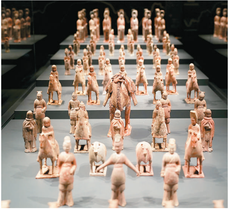
▲北魏彩塑陶俑。

展览将持续至2026年5月5日。展览期间将举办多场学术讲座、专家导览、教育体验等活动，让观众多角度了解白瓷文化，感受中华民族在历史长河中形成的文化向心力，体会古代匠人在传承中不断创新的智慧，进一步铸牢中华民族共同体意识。