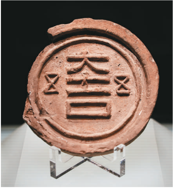
▲东汉“大吉”瓦当。