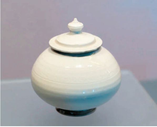
▲元代白瓷划花卷草纹盖罐（山西博物院藏）。

“北白——白瓷与民族融合”特展日前在山西博物院开展。本次展览汇聚了来自全国14家文博机构的200余件白瓷珍品，通过“南北融合”“四海同风”“和合共生”“寰宇雷霆”4个单元，以窗口串联的方式，全景式展示了北方白瓷的发展历程，讲述了白瓷背后的民族融合故事。