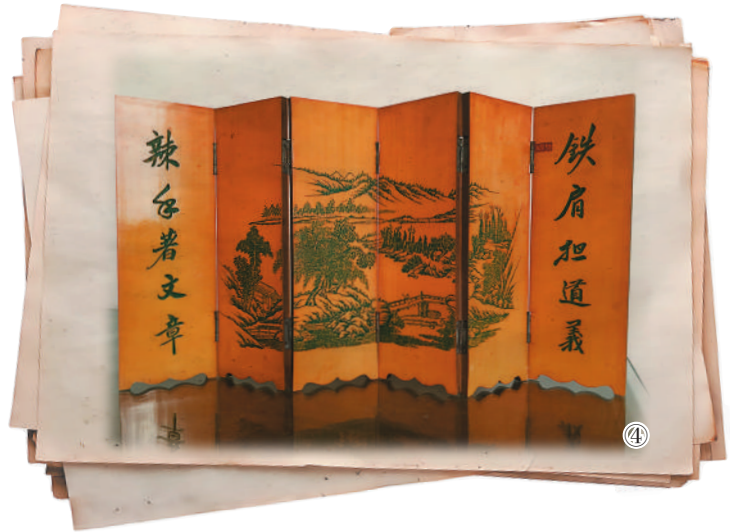
图④：新中国成立后，范长江书桌上一直摆放着这扇台式折屏。