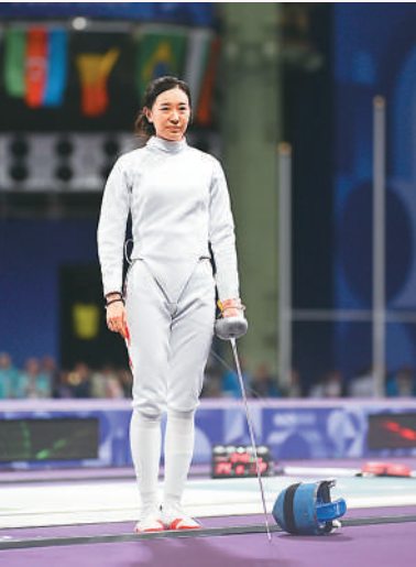
二〇二四年七月，孙一文在巴黎大皇宫举行的巴黎奥运会击剑女子个人重剑比赛中。