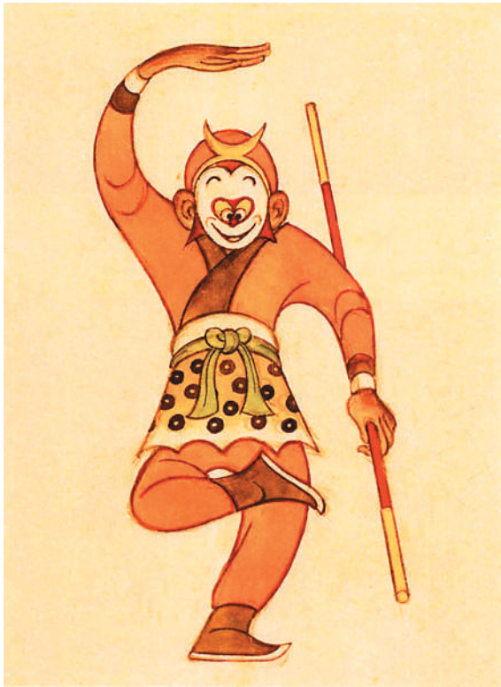
▲《大闹天宫》孙悟空设计稿之一 张光宇作

1978年，在云南省西双版纳傣族自治州采风的乔十光，于澜沧江畔观看泼水节龙舟竞赛。他被三五成群、扎着高高发髻的傣家妇女吸引，由此创作了漆画《泼水节》。画中人物形象，皆出自乔十光在当地的百