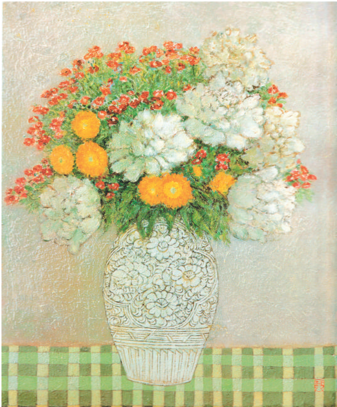
▲瓶花（油画） 庞薰莱作