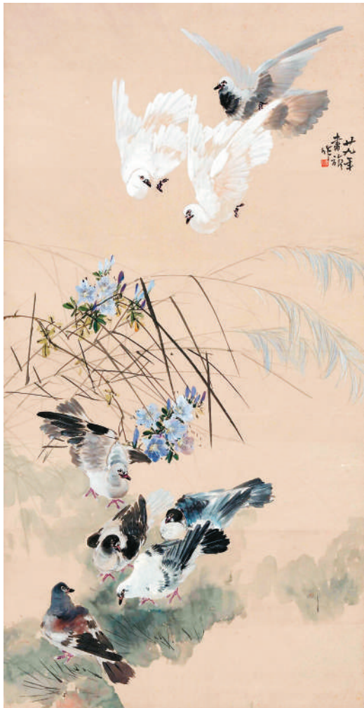
▲群鸽（中国画） 张书旂作

张书旂始终希望与世人分享自然的无尽之美：色彩、形态与肌理的多样，生灵的蓬勃与自由。飞鸟掠空、彩蝶翻飞、巨木迎风、鲜花盛放的刹那之美，倏忽之间，转瞬即逝。张书旂以他所擅长的中国笔墨捕捉自然之韵，并将其鲜活地定格于宣纸之上。