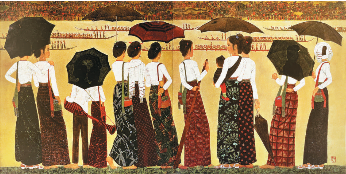
▲泼水节（漆画） 乔十光作