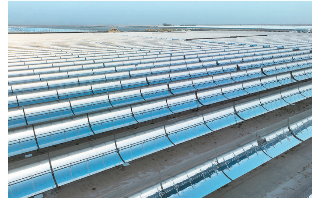
图为中国与阿联酋共建的迪拜马克图姆太阳能公园四期光伏综合发电项目槽式集热器(无人机照片)。