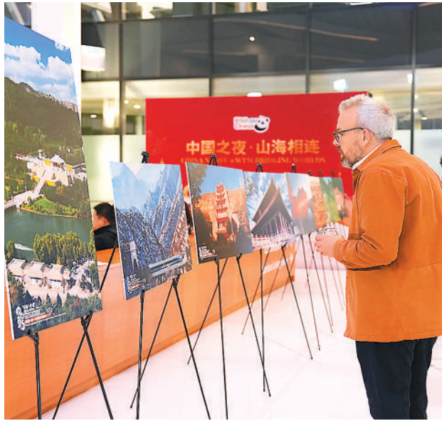
外国来宾现场观看“你好！中国”2025世界文化遗产主题旅游海外推广季图片展。