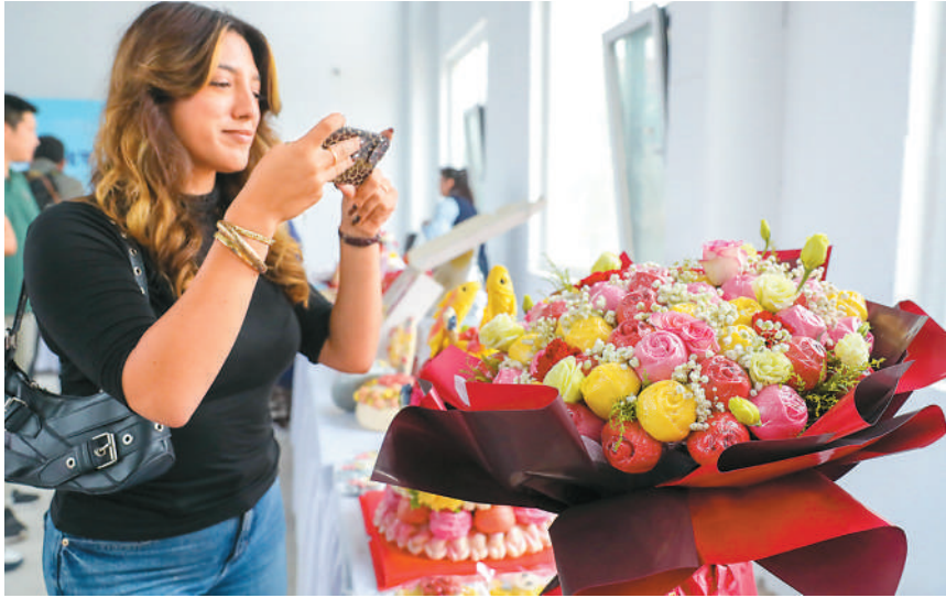
在2025第十二届青岛王哥庄大馒头文化节现场，外国游客拍摄花样馒头。

要流量，更要质量。中国旅游研究院数据分析所所长张杨建议，应增强文化保护意识，深入挖掘民俗背后的精神内涵。同时，重视创新表达，利用视频展示非遗技艺，利用新技术还原历史场景，利用文创产品让风物走进日常生活。