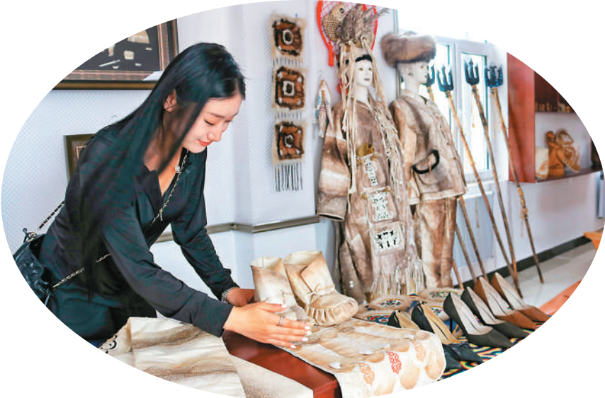
游客在黑龙江省同江市，近距离体验赫哲族鱼皮技艺，手触鱼皮鞋履，感受古老技艺的独特之处。