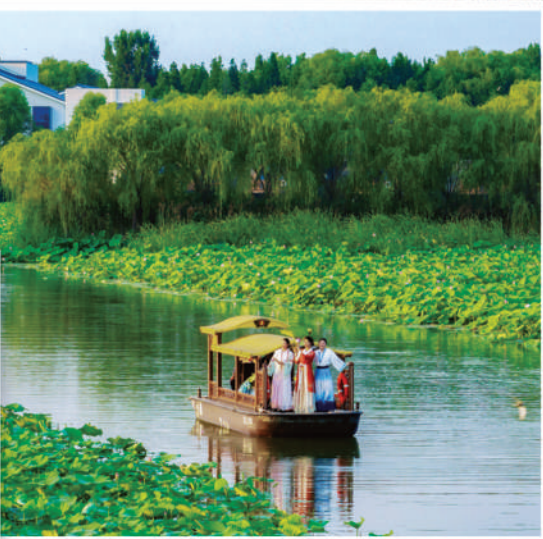
▲微山湖。 ▲孔府菜体验活动。 ▲京杭大运河济宁段。