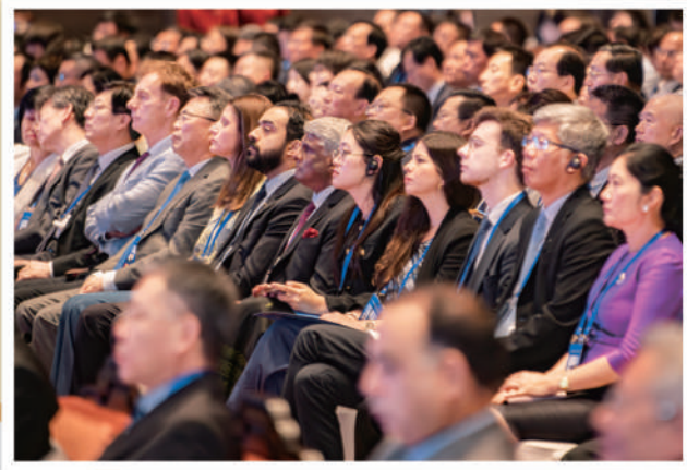
▲来自海内外的专家学者参加尼山世界文明论坛。