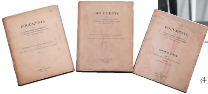
重庆图书馆藏的《联合国宪章起草文件》共3册，包含1册索引和2册起草文件。

联合国数字图书馆的文献中，记录了一些中国代表团成员在联合国制宪大会上的发言。例如吴贻芳表示：“我们在这里所做的工作，不过是为新的世界组织起草一份宪章。至于这个机制如何运作，我们必须依赖于各国政府和人民执行联合国宪章条款的决心。尽管我们极为重视这一机制，但它也只是我们工作的起点。中国代表团认为，首先，我们必须不遗余力制定一部宪章，但与此同时，我们必须希冀各国政府和人民的意志与决心来执行联合国宪章所规定的内容。正因为如此，中国代表团才强调国际法发展、国际教育合作等方面的重要性，以在各国人民之间达成共识，维护世界各国的和平。”