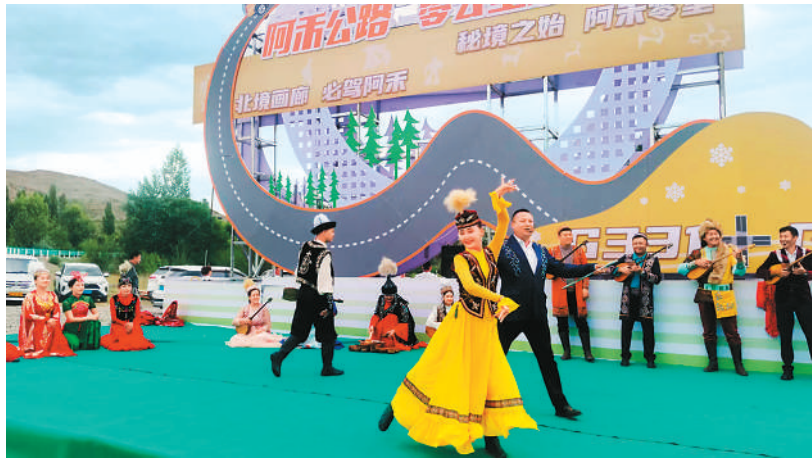
阿勒泰雪都演艺公司的演员在阿禾公路零公里处起点处为游客演出。