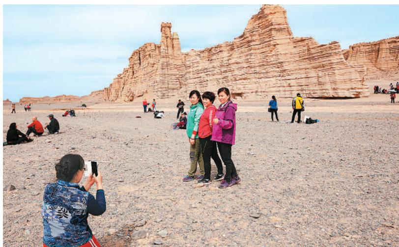
游客在哈密大海道景区合影留念。