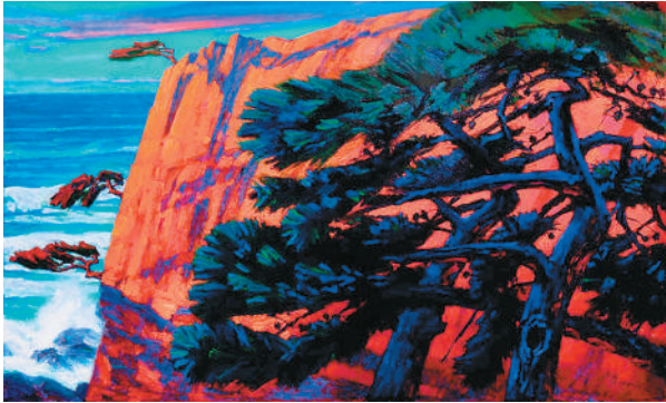
听涛—红霞（油画） 詹建俊作

9月19日，由中国油画学会、中国美术学院、中央美术学院、上海美术馆联合主办的“巍巍者华——中国油画学会三十年纪念大会暨艺术展”及系列学术活动在上海美术馆开幕。这场汇聚全国油画力量的艺术盛会，不仅回溯中国油画学会30载发展历程，还以丰富多元的作品，展示了中国油画在语言探索、风格演进与精神表达上的丰富层次与时代风貌。