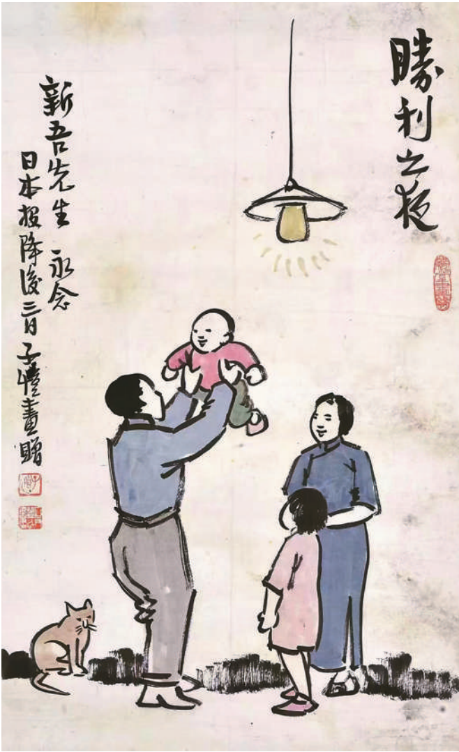
胜利之夜（中国画） 丰子恺作