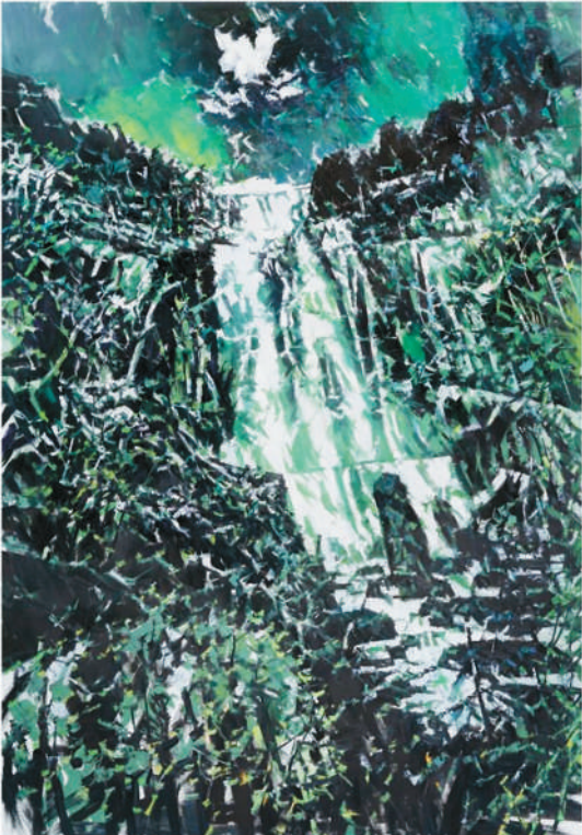
关于远山的迷宫·瀑（油画） 许 江作