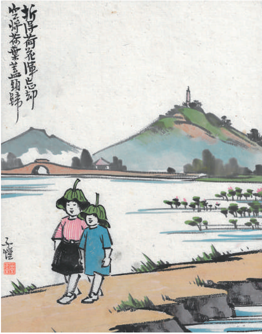
折得荷花浑忘却 空将荷叶盖头归（中国画） 丰子恺作

之所以是“古诗新画”，在于丰子恺在研读古代诗文时，真切感受到其穿越时间的魅力。宋代苏轼提出“诗画本一律”之说，明确了诗画相通的理论。丰