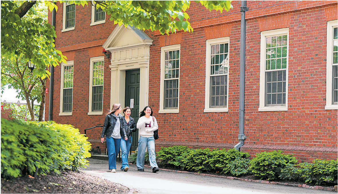
学生走在美国哈佛大校园内。

开学季到来，学子们将在海外开启全新生活。远离父母亲人、独自在异国他乡学习，这对每名留学生来讲都是不小的挑战。如何尽快融入新环境、建立自己的社交网络？