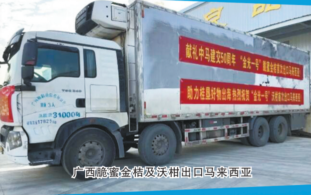
广西脆蜜金桔及沃柑出口马来西亚