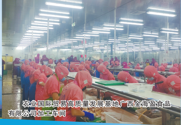
农业国际贸易高质量发展基地广西金海源食品有限公司加工车间