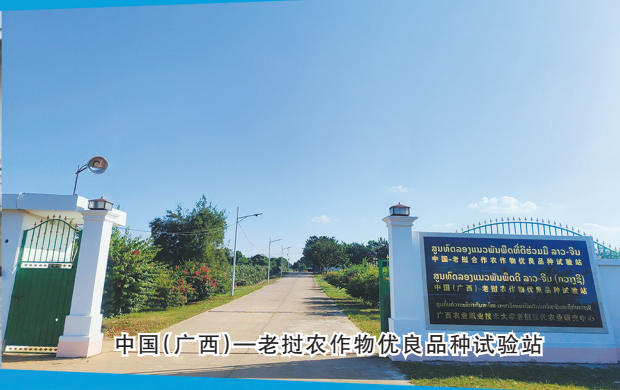
中国(广西)—老挝农作物优良品种试验站