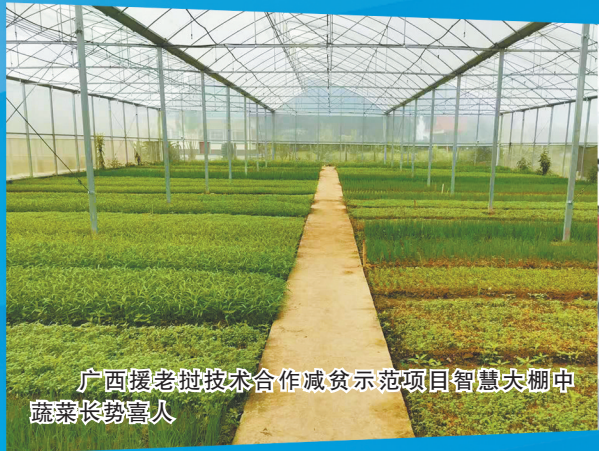
广西援老挝技术合作减贫示范项目智慧大棚中蔬菜长势喜人