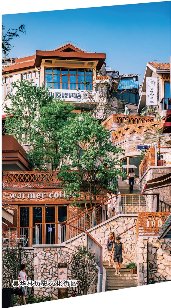
昙华林历史文化街区