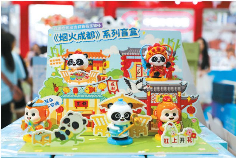
成都世运会官方特许商品零售店展出的商品。

围绕“赛事+旅游”融合,成都还策划推出六大主题文旅线路,如“活力世运游成都”“舌尖滋味游成都”“千年文脉游成都”等,围绕世运会的13个室内赛事场馆,推出26个主题场景点位,带动文旅消费升级。参赛选手和游客可跟着世运去旅行,沉浸式体验巴蜀美食、非遗技艺与城市地标。