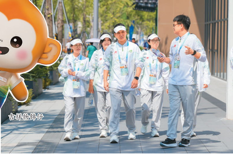
志愿者在成都世运会运动员村A区巡村。