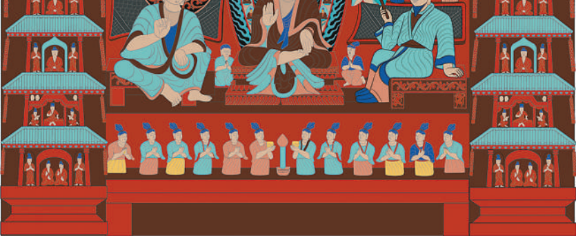
第六窟南壁中部第三层庖殿龕（色稿）。