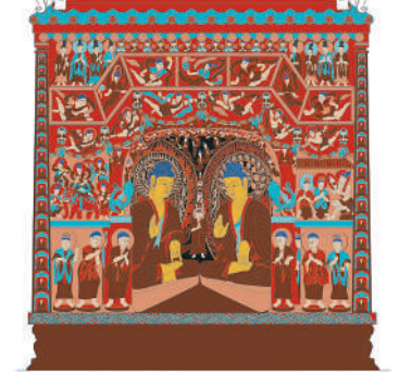
第六窟中心塔柱北面（色稿）。

为避免“全而不精”，编辑团队建立了“五级审校”机制：考古专家审查“纹样准确性”、艺术史学者把关“风格演变”、技术团队验证“数字还原度”、编辑团队优化“逻辑结构”、读者代表评估“可读性”，以期