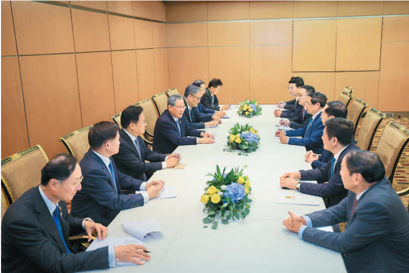
当地时间5月27日下午，国务院总理李强在吉隆坡出席东盟—中国—海合会峰会期间会见越南总理范明政。

本报吉隆坡5月27日电（记者刘慧、王迪）当地时间5月27日下午，国务院总理李强在吉隆坡出席东盟—中国—海合会峰会期间会见越南总理范明政。