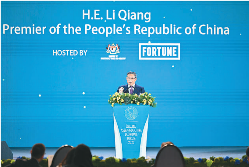
当地时间5月27日晚，国务院总理李强在吉隆坡同马来西亚总理安瓦尔、越南总理范明政共同出席东盟—中国—海合会三方经济论坛开幕式并致辞。

本报吉隆坡5月27日电（记者章念生、王迪）当地时间5月27日晚，国务院总理李强在吉隆坡同马来西亚总理安瓦尔、越南总理范明政共同出席东盟—中国—海合会三方经济论坛开幕式并致辞。