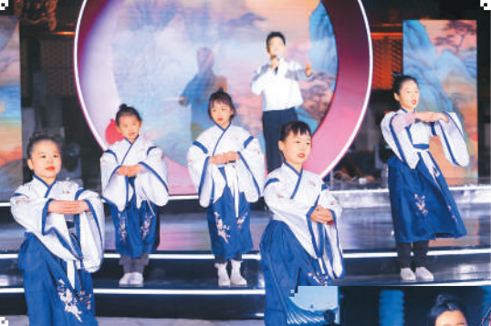
▲节目《弦歌不辍》表演现场。

据悉，“何以东方美”文化传播项目将启动系列巡展，持续助力中华优秀传统文化广泛传播，奏响与时代共振的“文化交响”。