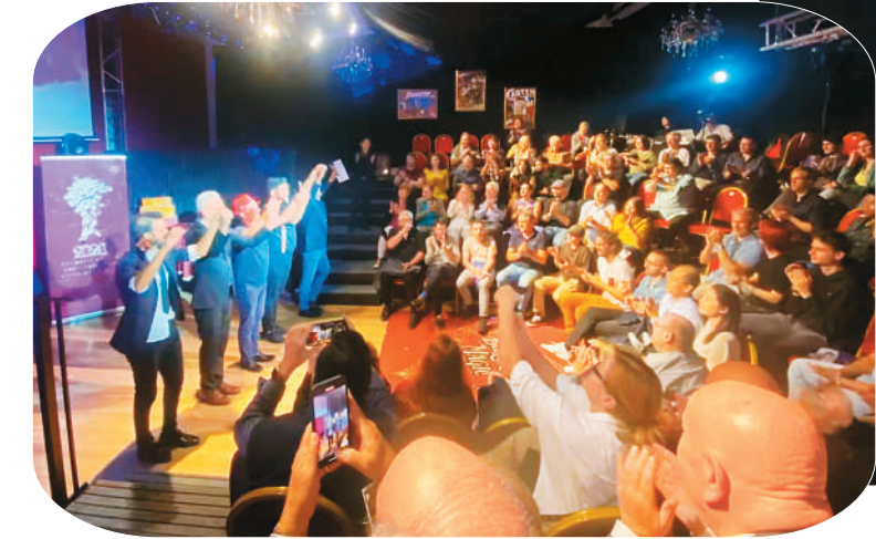
▲“金菊飘香”中国魔术专场演出在奥地利演出。

“什么样的网络文学更具有转化价值?”这一议题引发了与会者的探讨。在短剧、动漫、影视剧蓬勃发展的背景下，IP改编已成为各大网络视听平台角逐的关键赛道。爱奇艺影视文学研发中心总经理张晓媚认为，影视改编需要有具备情感共鸣的内容，兼顾头部与中部作家作