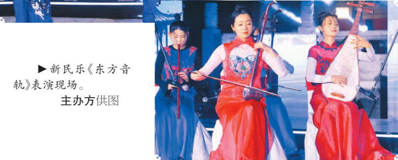
►新民乐《东方音韵》表演现场。