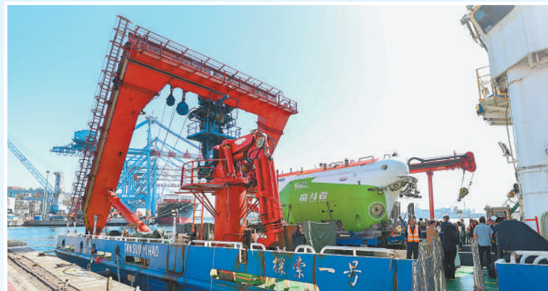
▲3月5日,停靠在智利瓦尔帕莱索的中国“探索一号”科考船。