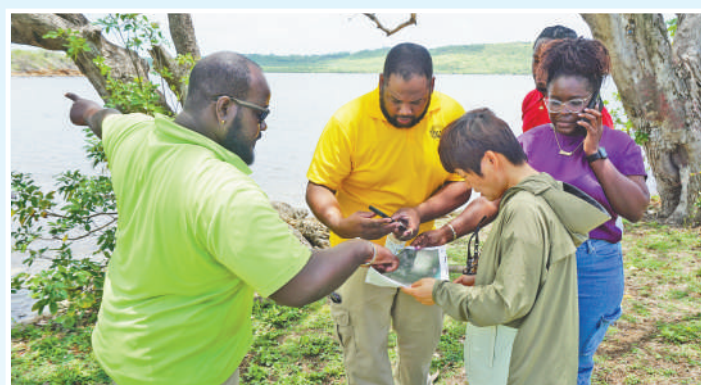
▲联合团队在安提瓜和巴布达开展海洋空间规划海岸带踏勘。

“从应对气候变化、推进生态修复,到分享技术经验、加强基础设施建设,太平洋岛国与中国的合作是全方位的,双方合作为推动太平洋岛国走上可持续发展之路提供了重要助力。”普拉塔普表示,中国与太平洋岛国蓝色经济合作前景广阔,双方继续深耕海洋高附加值产业、清洁能源、海上基建等领域,推动更多蓝色经济项目落地,将为当地民众带来更多发展机遇。