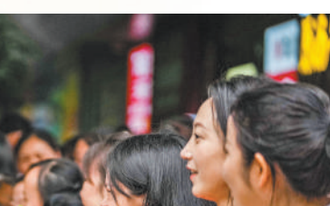
图④:贵州省贵阳市乌当中学考点,送考老师为考生加油。