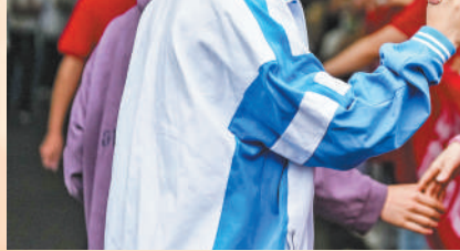
图③:辽宁省沈阳市东北育才学校考点,交警护送考生。