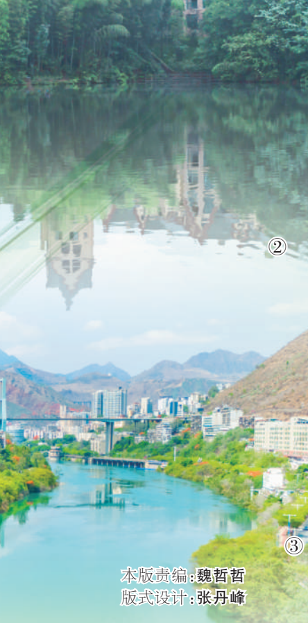
本版责编:魏哲哲 版式设计:张丹峰