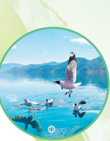
图①:云南丽江,泸沽湖水天一色,鹭鸟翔集。

大江奔流,法治护航。从赤水河的“破冰”探索,到嘉陵江、泸沽湖、大熊猫国家公园的协同推进,一幅幅由跨区域协同立法绘就的“共抓大保护”图景,正在长江上游徐徐展开,共护一江碧水永续东流,两岸青山葱郁常在。