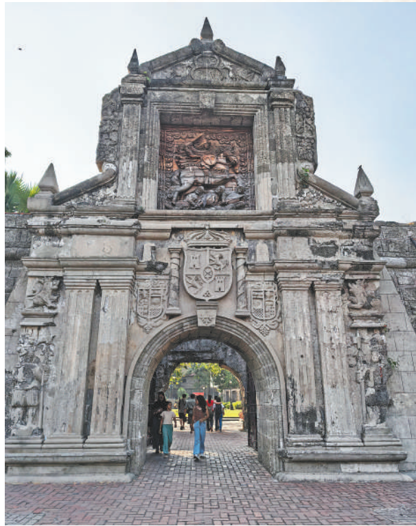
圣地亚哥堡石门。