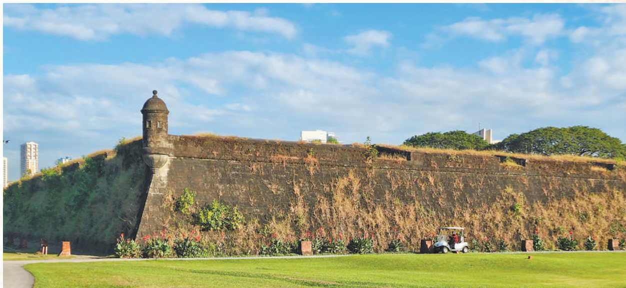
圣地亚哥堡石门。

1946年菲律宾完全独立后，圣地亚哥堡历经修复成为纪念公园和旅游景点。当年城墙外的护城河被改造为高尔夫球场，原来的兵营与教堂变为表演厅，园区还增设雕塑、纪念品商店等。然而那些被战争破坏的残垣断壁，仍提醒