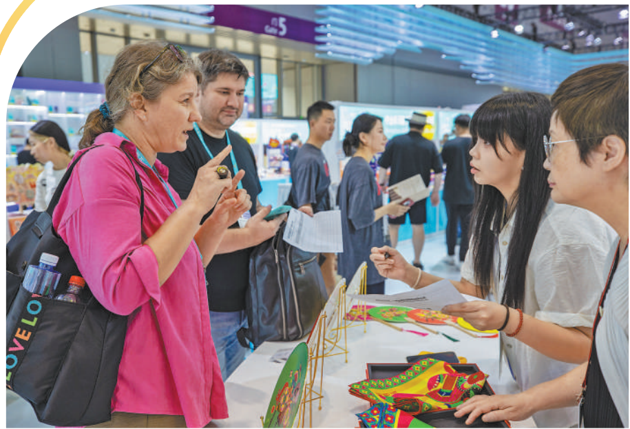
▲外籍客商向展位工作人员咨询非遗文创产品。