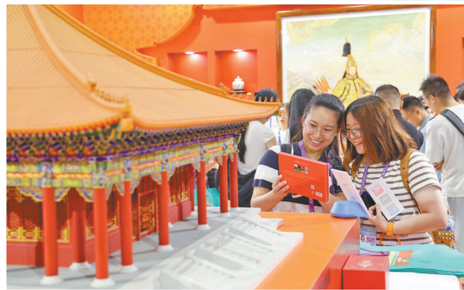
▲观众在故宫博物院展台选购文创产品。