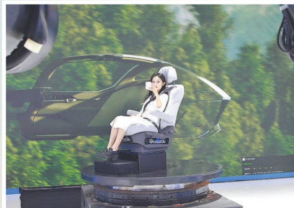
▲观众体验智能电影模拟制作过程。