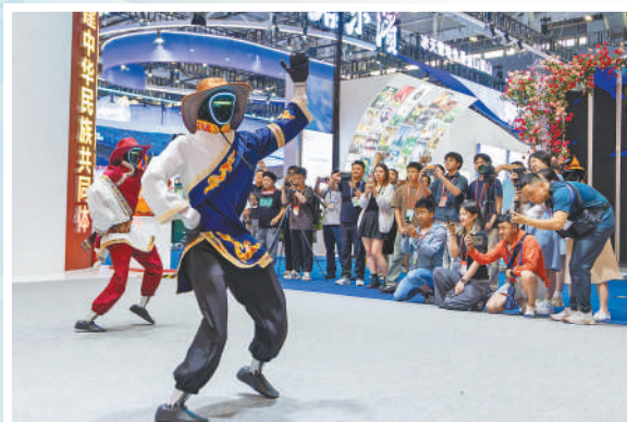
◀人形机器人在进行舞蹈表演。