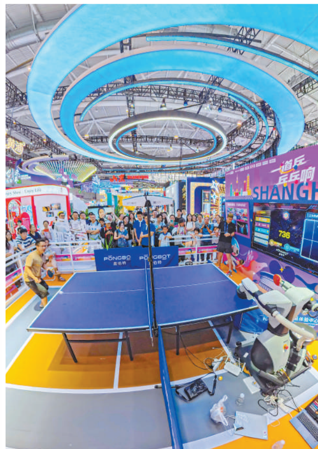
▼观众参与智能发球机器人体验活动。