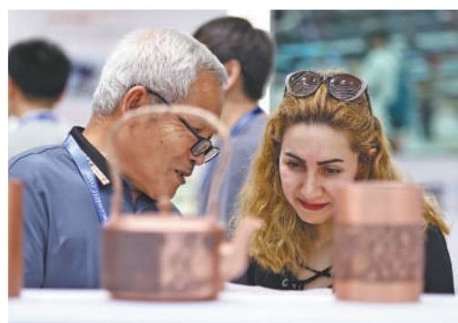
▲工作人员向外籍客商介绍铜壶制作工艺。