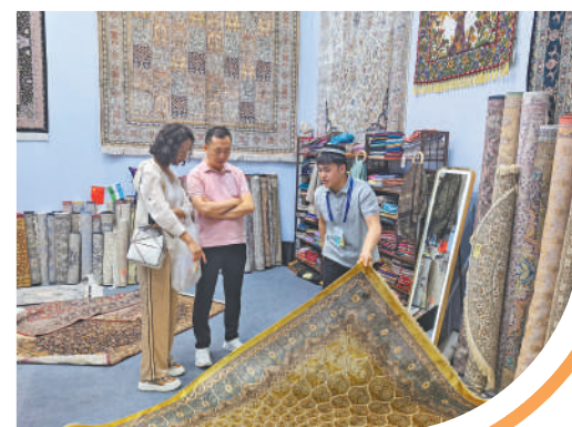
▼全球文化贸易馆乌兹别克斯坦展区,工作人员(右)与客商洽谈合作。