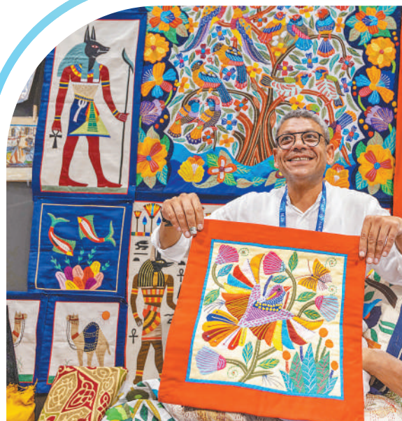
▲埃及展商展示手工艺品。