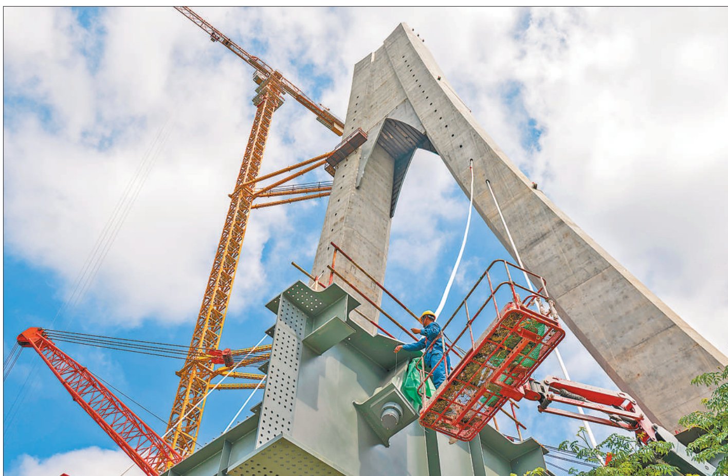
5月21日,江苏省宿迁市云帆大道京杭运河特大桥建设工地,工人在紧张施工。云帆大道京杭运河特大桥是235国道关键工程,预计2026年底建成通车。

本报南宁5月21日电 (记者庞革平)广西南宁市数据领域国际合作试点工作近日正式启动,成为国家首批数据领域国际合作试点城市之一。广西将聚焦中国—东盟数据流通、算力协同、产业赋能核心需求,打造面向东盟区域的数据开放合作高地。 在数据基础设施建设上,广西将大幅降低至东盟数据传输的时延,建设面向东盟的跨境算力服务区等数据跨境流动服务基础设施。 在跨境服务生态构建上,广西将着力推动中国与东盟数据治理规则互认,建设中国—东盟数据交易服务网络,搭建一站式跨境合规服务平台,提供数据出境评估、安全审计、合规认证等服务。 在数字合作场景培育上,广西将构建“北上广研发+广西集成+东盟应用”跨境产业生态;深耕智慧交通、跨境贸易、数字内容出海等重点领域,培育一批“小而美”标杆项目。