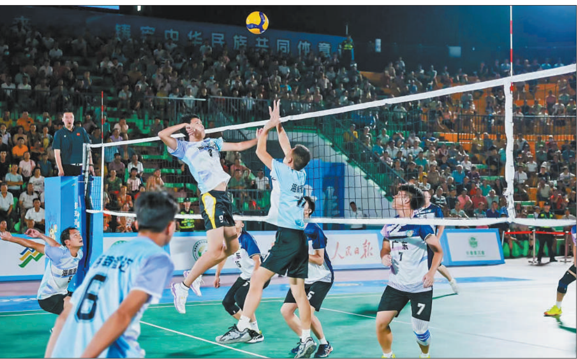
“村排”男子六人制排球赛（乡村组）第三轮，海南澄迈队对阵广东江门百香顺队。

灯光下的排球场，欢呼声一浪接一浪。海南省澄迈县大丰镇的活动中心里坐满了观众，每一次排球与地面的撞击，都激起一波加油助威的声浪。