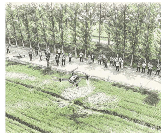
在河南焦作博爱县一处农田，大家财险帮助农户进行“一喷三防”作业等农业保险风险减量服务。